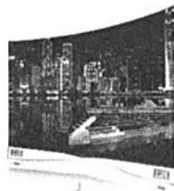
8. Lg Tv Oled con display curvo (8.999 euro)