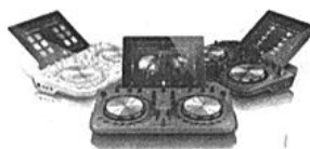
10. Pioneer Digital DJ WeGO2 (349 euro)