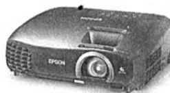
7. Epson EHTW5200 proiettore (914 euro)