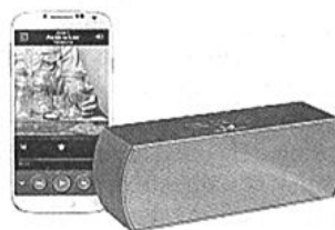
6. Fresh'N Rebel Rockbox (59,99 euro)

Scegli il regalo hi-tech ideale per il prossimo Natale